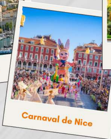
Carnaval de Nice