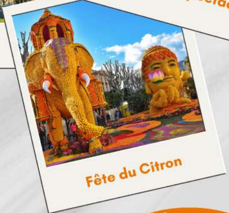
Fête du Citron