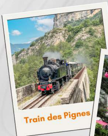
Train des Pignes