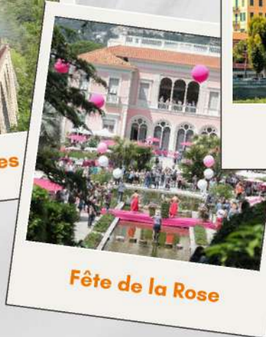
Fête de la Rose