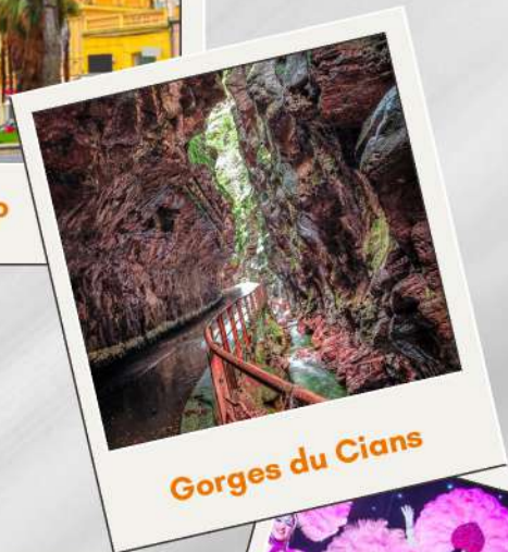
Gorges du Cians